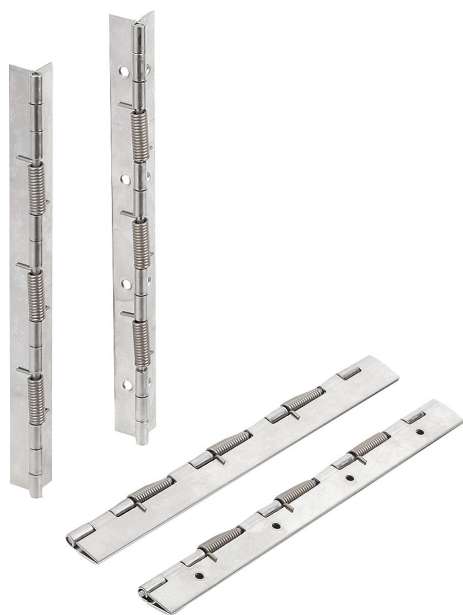
Cerniere con molle di chiusura