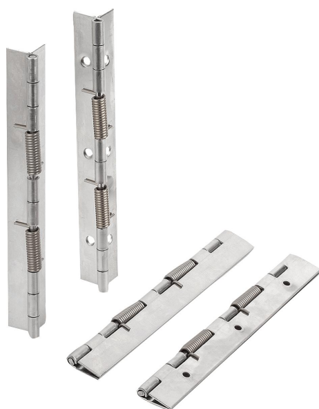
Cerniere con molle di chiusura